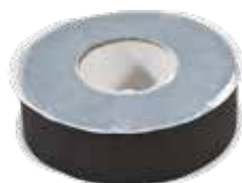
ADHEO SUPER 50