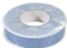
ADHEO SUPER 38

Pour renforcer l'étanchéité à l'air, notre gamme d'adhésifs permet de réaliser le traitement des points singuliers et les jonctions verticales et horizontales des lés.