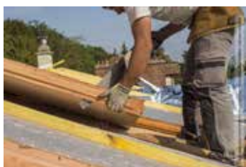
Compatible avec notre solution d'isolation de toiture par l'extérieur SARKEO FEU.